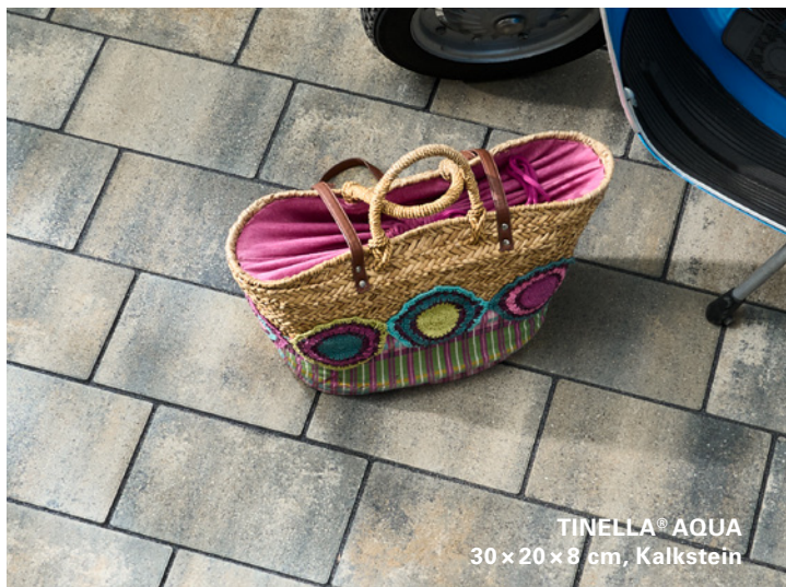
TINELLA® AQUA 30 x 20 x 8 cm, Kalkstein

Verwenden Sie drainagefähiges Fugenmaterial „Basalt 1–3 mm“, ein Pflasterbettungsmaterial „Basalt 2–5 mm“ sowie einen drainagefähigen Unterbau. Regenwasser kann bei dieser Bauweise schnell abfließen und wird auf kürzestem Wege wieder dem Wasserkreislauf zugeführt.