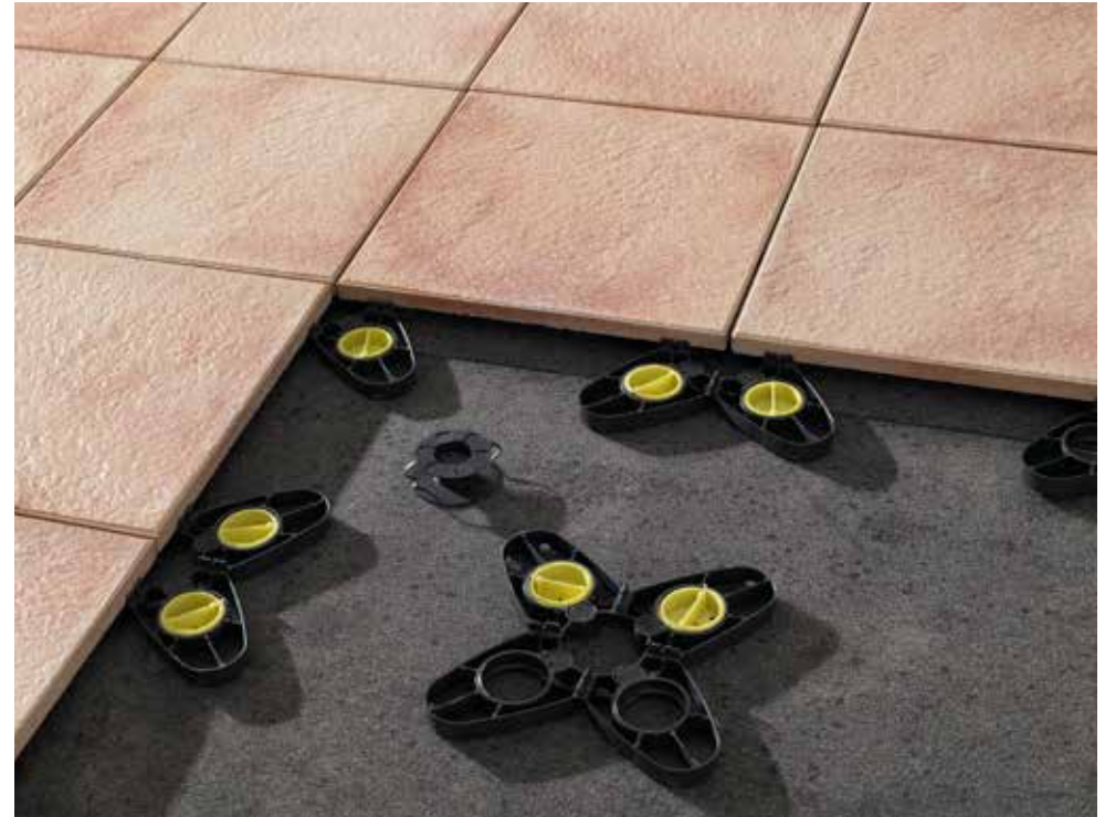
AVELINA® auf Stelzlagern / Mörtelsäckchen

Tipp: Nutzen Sie bei der Verlegung als Abstandshalter die nur 10 mm hohen und 3 mm breiten AVELINA®-Fugenkreuze und verwenden Sie geeignetes Einkehr- und Bettungsmaterial. Bei der Nutzung von Mörtelsäckchen/Stelzlagern unbedingt auf eine 5-Punkt-Verlegung achten! Eine Mindestfugenbreite von 3 mm gemäß DIN 18318 und eine ausreichende Entwässerung des Unterbaus müssen gewährleistet sein!