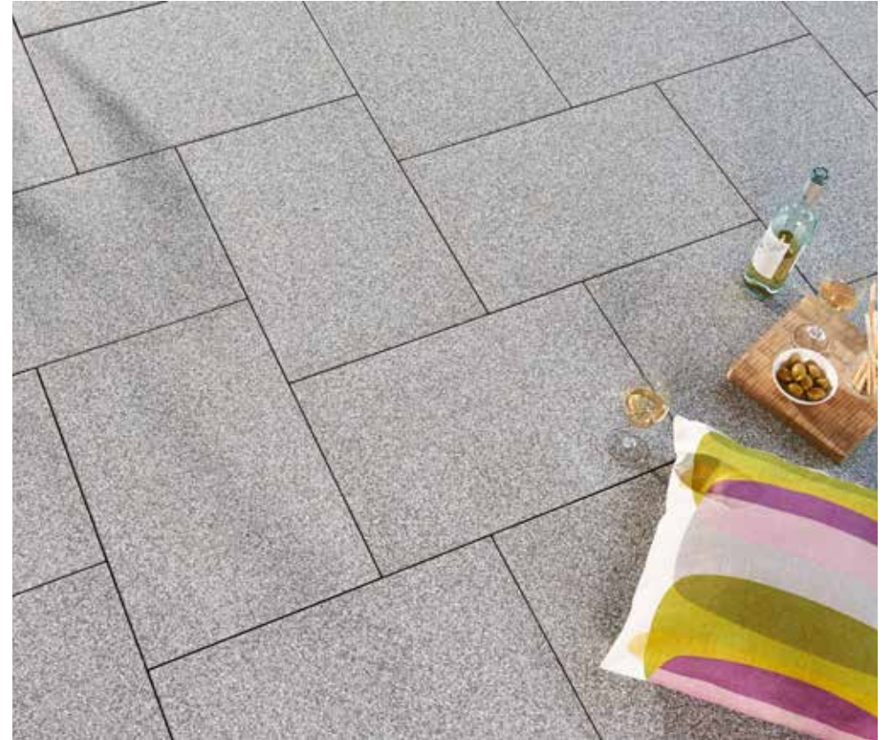
AVELINA® XL gestrahlt, anthrazit