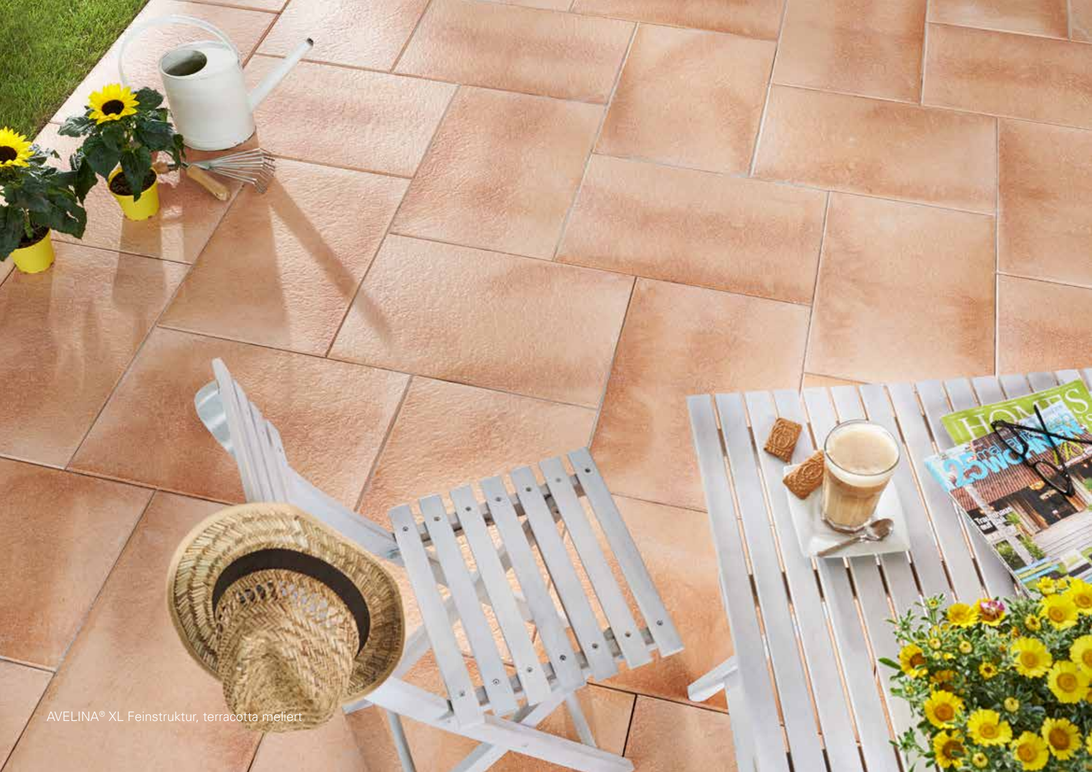
AVELINA® XL Feinstruktur, terracotta meliirt