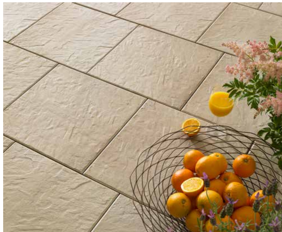
AVELINA® Schieferstruktur, sandsteinbeige