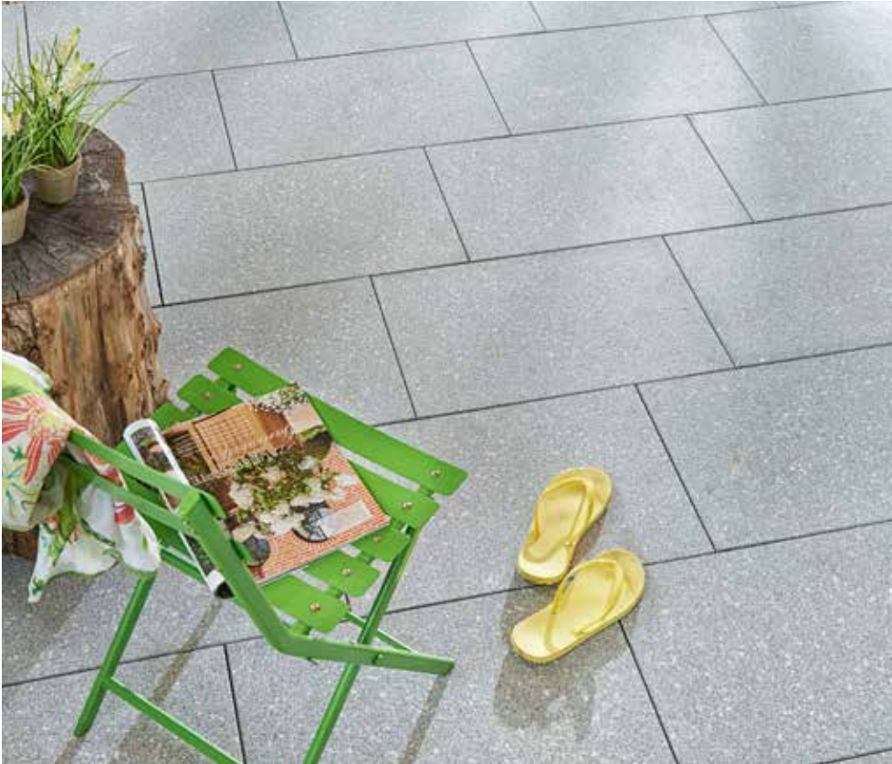
AVELINA® XL gestrahlt, grau