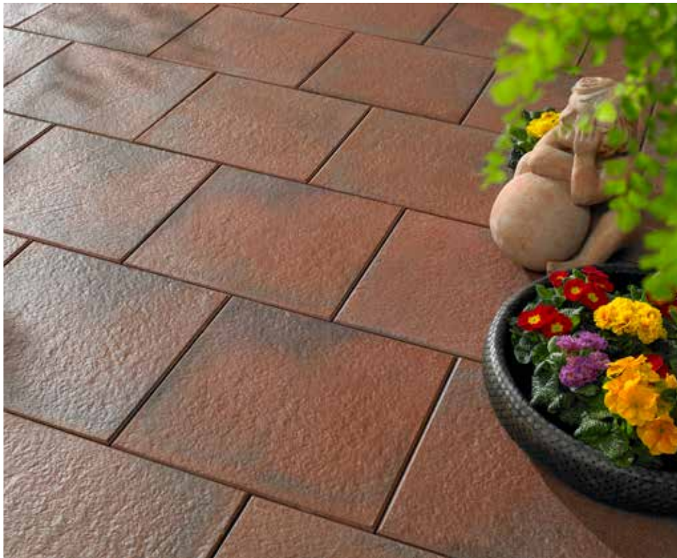
AVELINA® Feinsteinzeug, rot-braun meliert