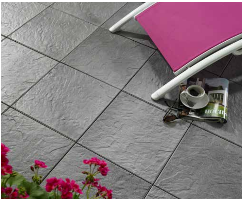
AVELINA® Schieferstruktur, schiefer

AVELINA®-Platten sparen gut 50 % an Ressourcen und Transportaufwand im Vergleich zu herkömmlichen Terrassenplatten ein und sind dabei 100 % recycelbar.