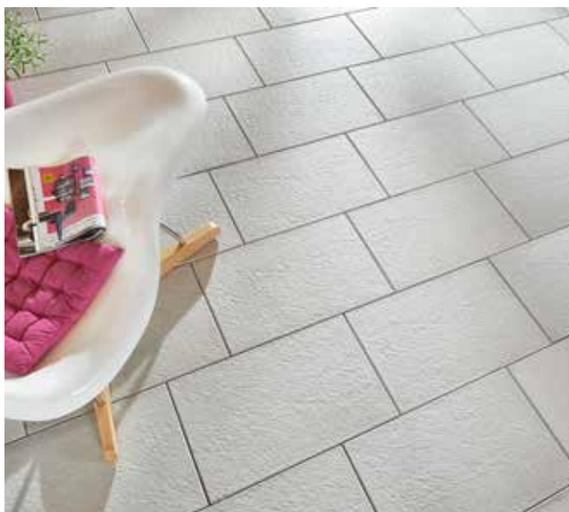
AVELINA® XL Feinstruktur, ice grey

Sie erhalten AVELINA® bei Ihrem Baustoff-Fachhändler in den nebenstehenden Oberflächen und Farben.