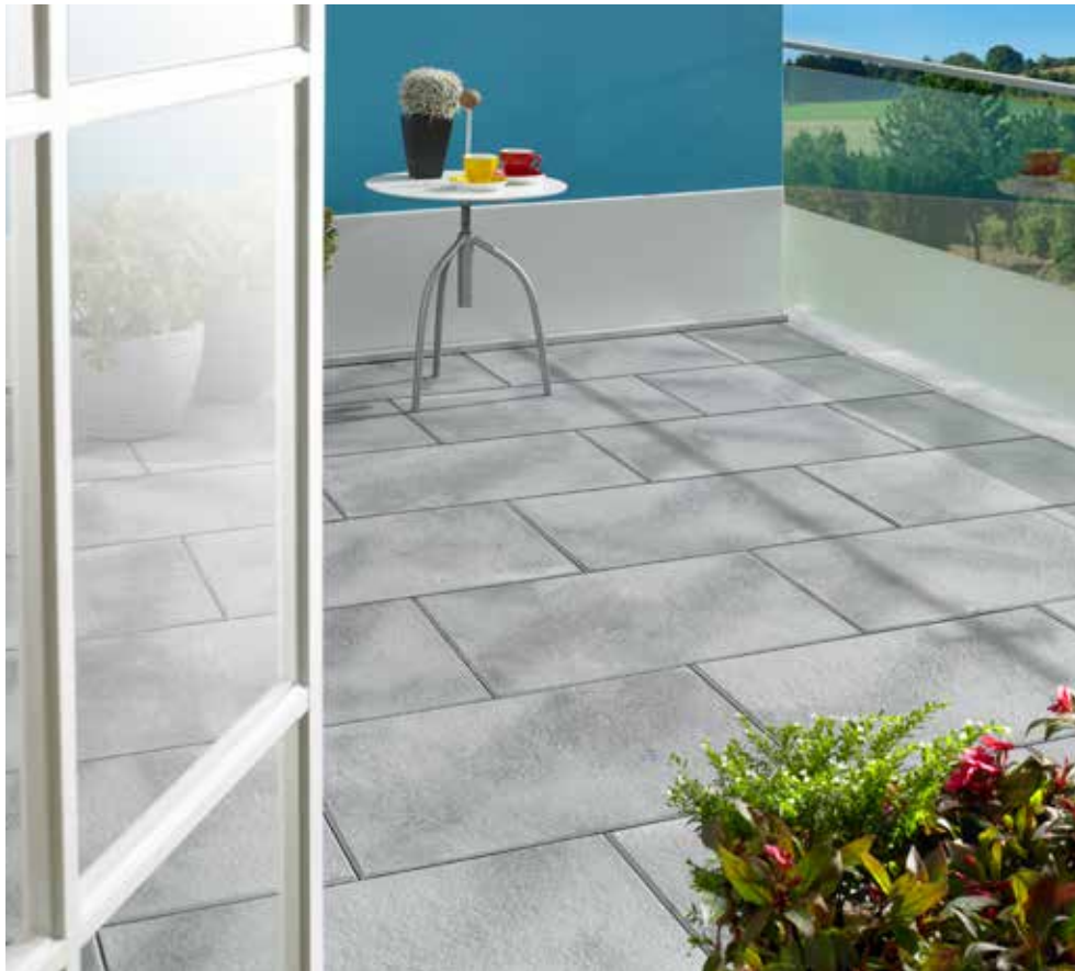
AVELINA ® XL Feinstruktur, silber-grau meliert

In den natürlich melierten Farben versprüht AVELINA ® XL besondere Freude und verbreitet auf jeder Terrasse gute Stimmung!