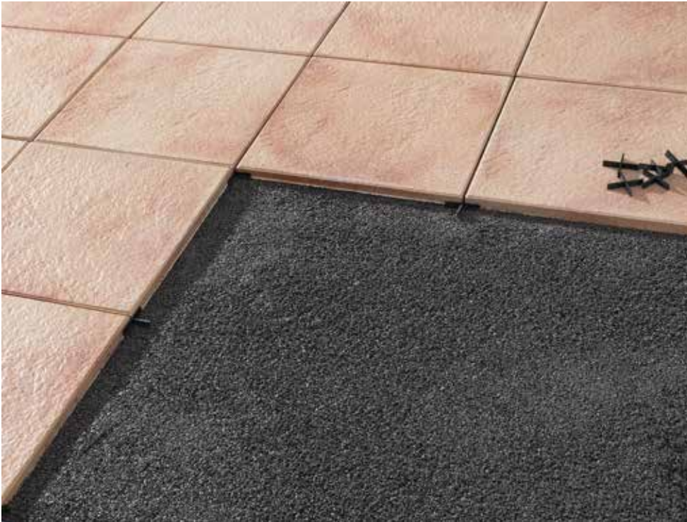
AVELINA® auf Splitt