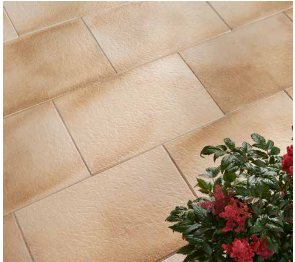
AVELINA ® XL Feinstruktur, terra-beige meliert