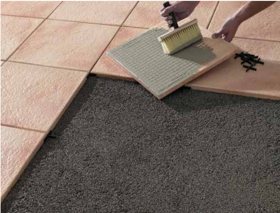
AVELINA® auf Drainagebeton