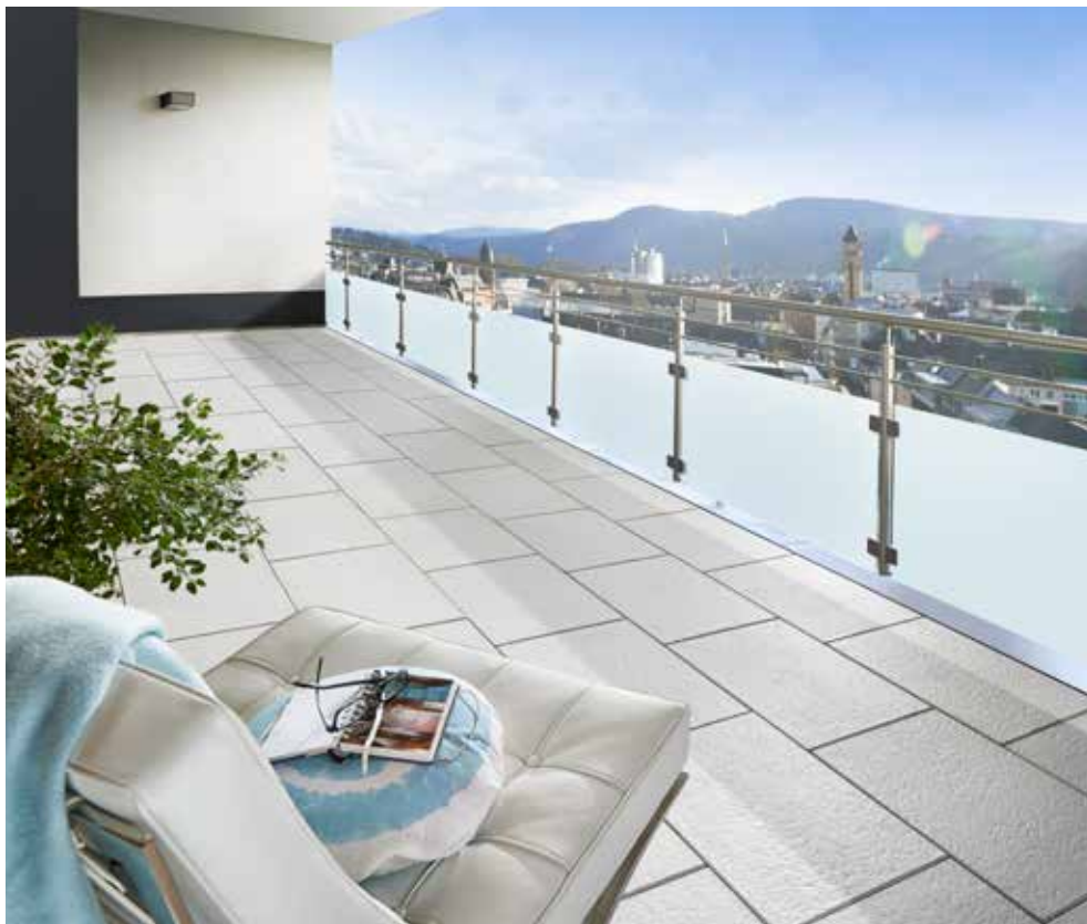
AVELINA® XL Feinstruktur, ice grey