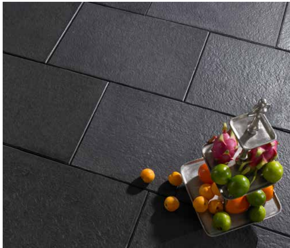
AVELINA® XL Feinstruktur, black